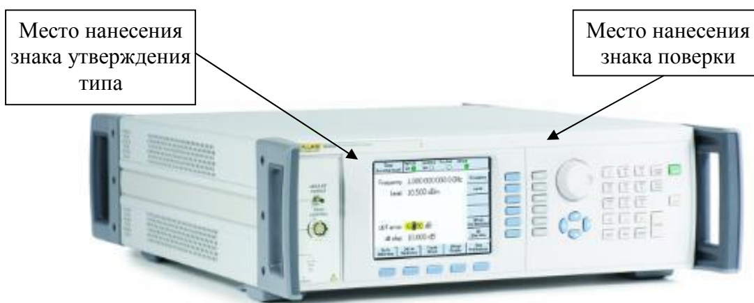
Рисунок 1 - Внешний вид источника модели 96040A

Внешний вид источников с указанием мест размещения знаков поверки и утверждения типа, а также мест пломбирования (наклеек) от несанкционированного доступа, приведены на рисунках 1-3.